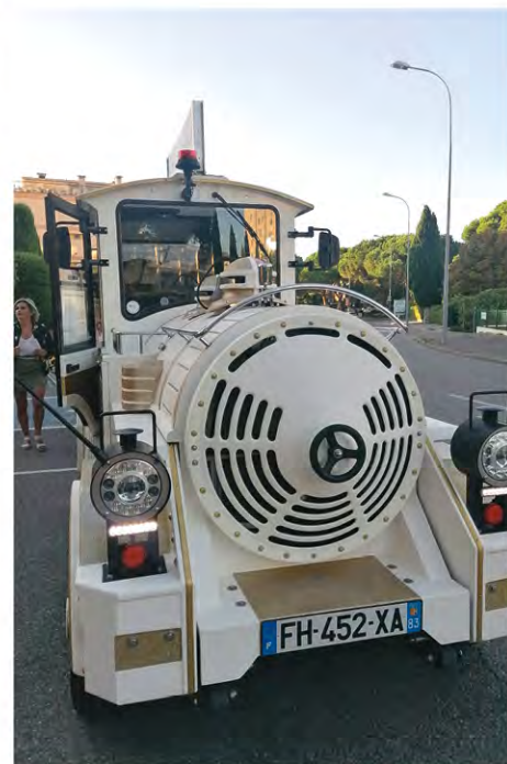
En bateau, en (petit) train, des seniors actifs