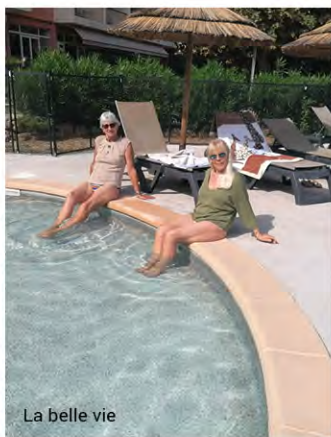
La belle vie