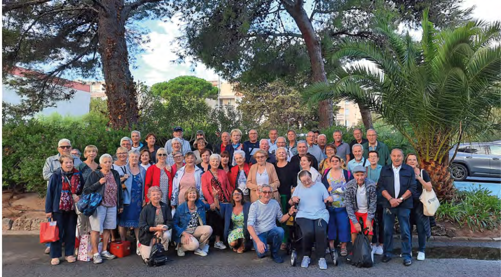
Photo de groupe sous les palmiers

Nos seniors ont quitté le Gard pour le Var, en septembre. Au programme une semaine de vacances autour de Sainte-Maxime, le Lavandou, Saint-Tropez...