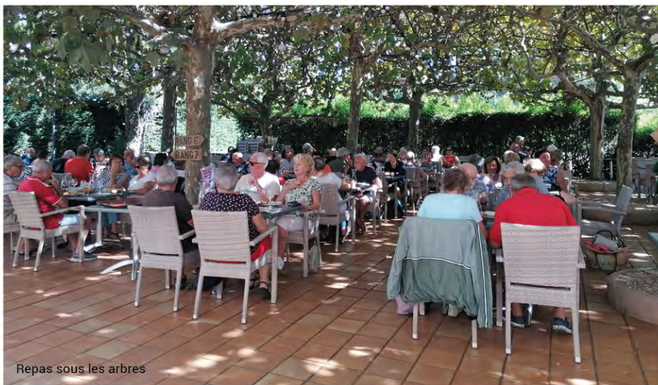
Repas sous les arbres