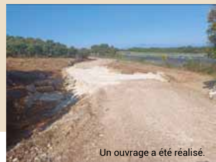
Un ouvrage a été réalisé.